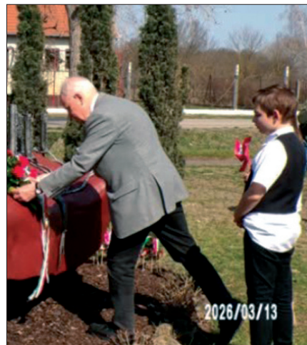
Kapcsolódó cikk a 2. oldalon.