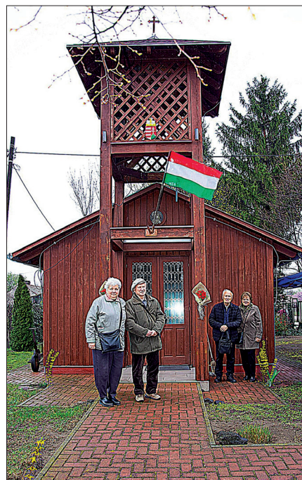
Kapcsolódó cikk a 5. oldalon.

A TARTALOMBÓL: • A képviselő-testület ülésén történt • Víz világnapi MESETÚRA az óvodában • Traktorosok figyelmébe! • Egyházi oldalak • Könyvtári hírek • Az Öveges Diáklaborban jártunk • Anyakönyvi hírek • Játszd újra! •