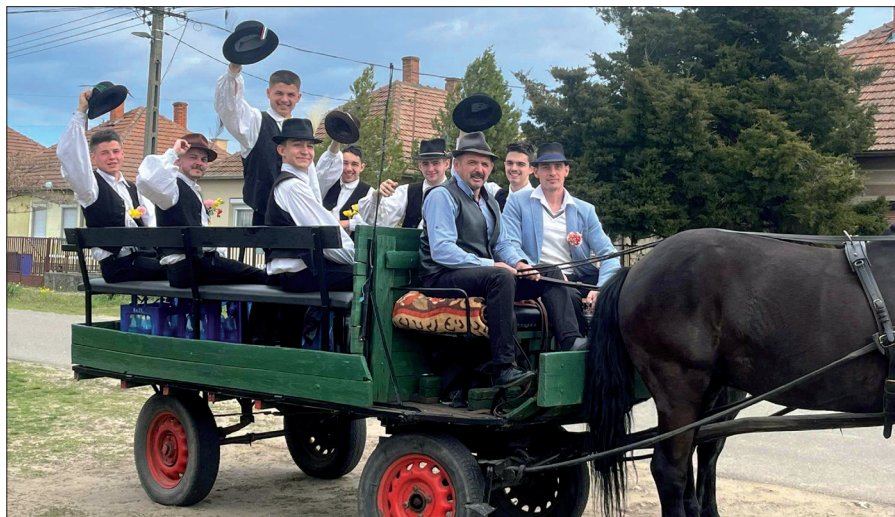
További fotó a 12 oldalon.