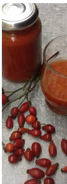
A kész csipke ital