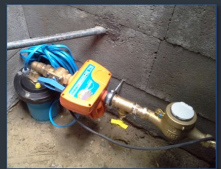
Aknában elhelyezett kút, szakszerű zárással, szivattyú vezérlővel és vízmennyiség mérővel

Bízunk benne, hogy tájékoztatónk segítségével egészségét és vizeink védelmét is szem előtt tartva hosszú távon használhatja a kútjából származó vizet háztartási céljaira.