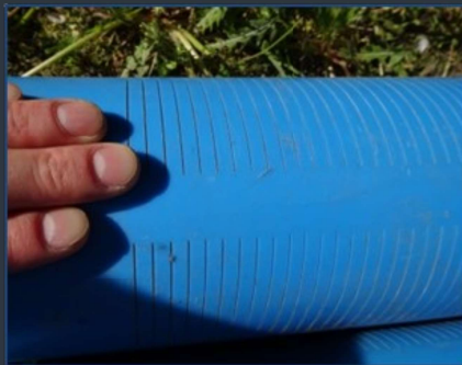
Megfelelő résmérettel kialakított, gyárilag perforált kút bélésű (szűrés)