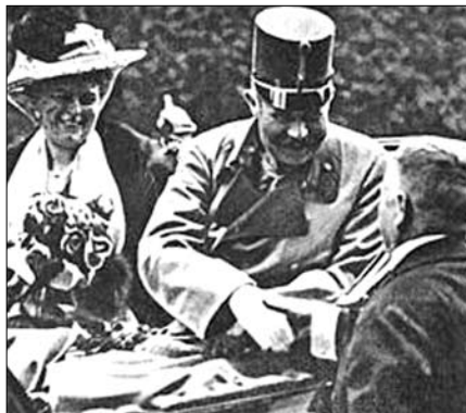
Ferenc Ferdinánd és hitvese közvetlenül a merénylet előtt

1913-ban Ferenc József megparancsolta Ferenc Ferdinánd főhercegnek, hogy látogasson el az egy évvel későbbi júniusi boszniai katonai hadgyakorlatokra. A tervek szerint a hadgyakorlatok után a főherceg a feleségével Sarajevóban az új állami múzeumot avatta volna fel. Chotek Zsófia – legidősebb fia szerint – a férjét támogatva kísérte el az útra. A bécsi udvarban Zsófiát rangon aluli házassága miatt közemberként kezelték. Ferenc József császár csak úgy egyezett bele a házasságba, ha utódaik nem lesznek trónörökösök.