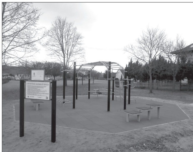
„B” típusú sportpark

Több éve felmerült már, hogy a meglévő játszótér a nagyobb gyerekek, kamaszok igényeit már nem szolgálja ki, illetve hogy a felnőttek is szeretnék közterületen elérhető fitness/kondi gépeket használni. Az így megfogalmazott célt követve, több forrás bevonásával igyekeztünk ennek az új szabadidő-töltési lehetőségnek helyet és eszközparkot kialakítani az elmúlt években.