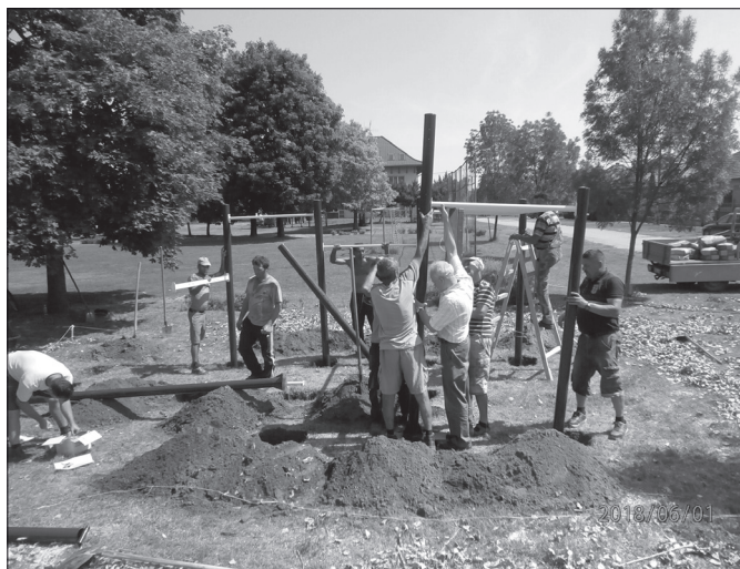
Az első komplex eszközök telepítése.