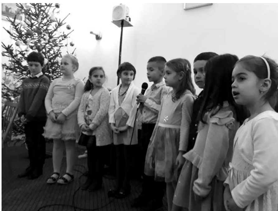
2019 Karácsonyán az óvodás és elsős református gyermekeink

Istennél az újjáteremtés nem öncél. Azt szolgálja, hogy nyitottabbakká váljunk Isten felé, egymás felé és általánosságban véve mindarra az újra, amit Isten hoz elénk. A megújulás gondolata lelkiképpen fontossá vált presbitériumunk számára, melyben igazából a reformációhoz kapcsolódunk, reformátusokként szüntelenül a megújulás gondolatában, de mégis sokkal inkább abban a felismerésben, hogy az utóbbi években inkább mindez az épületeink megújulására vonatkozott. A megújulásunk a gyülekezetünk égető szükségése is, mert a gyülekezetünk létszámára vonatkozó kicsinyiségünkől adódtak a problémáink, melyek mindig lehangolóvá, szomorkássá, jövőkép nélkülivé tették a gondolatainkat. Ennyien (kevesen) vagyunk, mégis – a Szentlélektől jövő megújulás