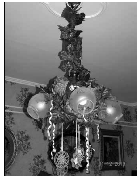
A mi adventünk: Pásztor Géza fotói

ígérte meg a megváltást. Lila gyertya (remény): a zsidó népre, amelynek megígérte, hogy közülük származik a Messiás. Rózsaszín gyertya (öröm): Szűz Máriára, aki várta és megszülte a Fiút. Lila gyertya (szeretet): Keresztelő Szent Jánosra, aki hirdette Jézus eljövételét és készítette az utat az emberek szívéhez.