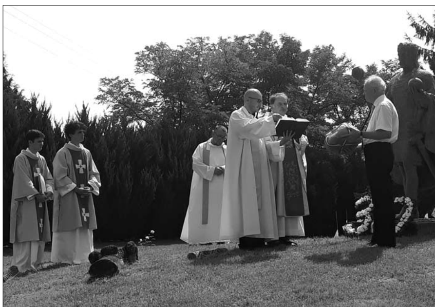
Kenyéráldás a Szent István szobornál.

lemben, aki nem mer veszélyt vállalni az álmai megvalósítására. Élj! Légy merész ma! Cselekedj mindjárt! Ne hagyd magad lassan meghalni! Ne