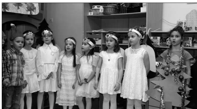
Angyalok és a kis girbe-görbe fenyő