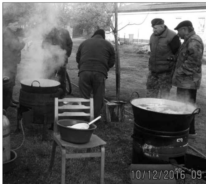
A kép jobb szélén az adományozó