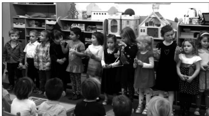
Karácsonyi műsor - Maci csoport