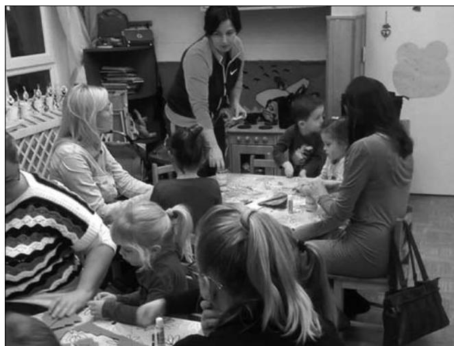
Adventi készülődés a Maci csoportban