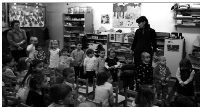
Karácsonyi műsor - Cica csoport