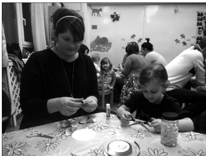
Adventi készülődés a Cica csoportban