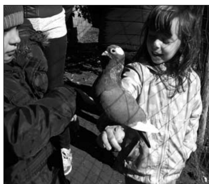
Galambot ültethettek a kezükre