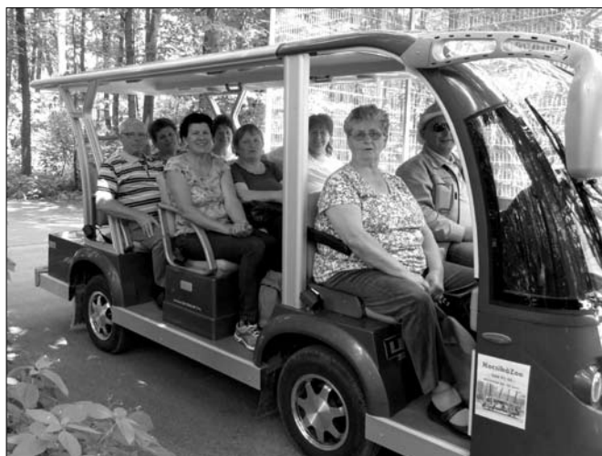
Egy kis állatkerti gyaloglás helyett.