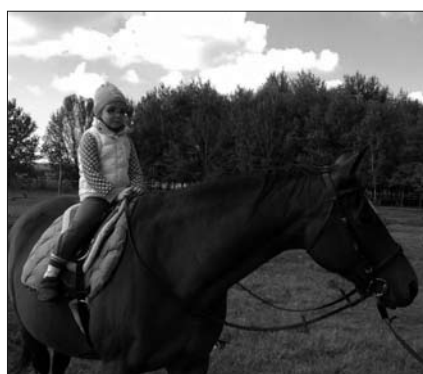
„Gyí paci paripa, ...”

Óvodánkban a hagyományos ünnepek mellett jelentős szerepet kapnak az úgynevezett zöld ünnepek. Október 04-én az Állatok Világnapja alkalmából felkerekedtünk és látogatást tettünk a Zsuzsi tanyán.