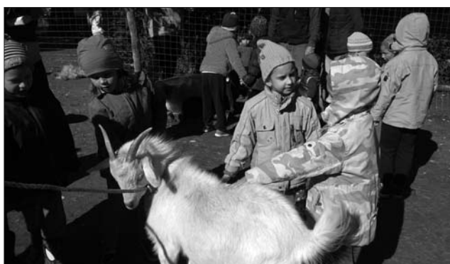
Az állatsimogatóban kecskét, bocit, birkát simogathattak.