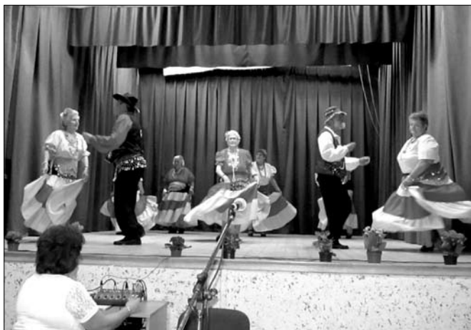
A Homokiak cigánytáncsal mutatkoztak be.

Évtizedek óta működik a nyugdíjasokat összefogó klub Szentkirályon. Jelenleg 64 tag van, nagyrészt helyiek, de vannak tagok Tiszakécskéről, Kocsérról is. A klubtagság önkéntes, bárki részt vehet, nemcsak nyugdíjas. Rendszeres, havonkénti klubnapot tartanak, melyeknek fénypontja az éppen aktuális születésnaposok és névnaposok köszöntése, cserébe az ünnepek vendégül látják a résztvevőket. Ezek az alkalmak rendszerint nótázással, szabadtéri szalonnasütéssel érnek véget. Ezek az alkalmakon egyeztetik a más települések klubjaival való kapcsolattartást, kölcsönös látogatásokat, kirándulásokat. Évenként két alkalommal, tavasszal és ősszel kerül sor településünkön nyugdíjas találkozóra, akár hat,