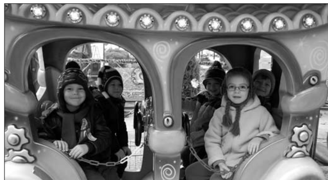
Felültünk a kisvasútra ...