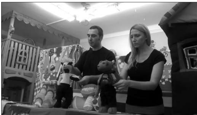
Mosolynap alkalmából az Ákom-Bákom bábcsoport előadását láthattuk.