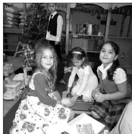
Végül megérkezett a Jézuska!