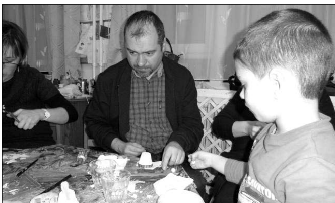
Adventi készülődés szülőkkel és gyermekekkel közösen.