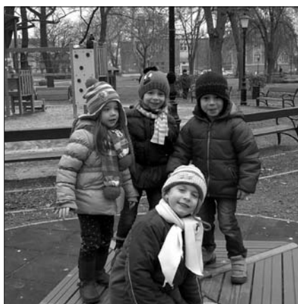
Játszottunk a vasútparki játszótéren.