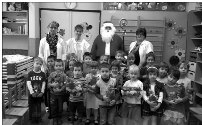
Megérkezett a Mikulás