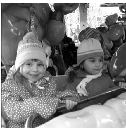
...és a körhintára is.