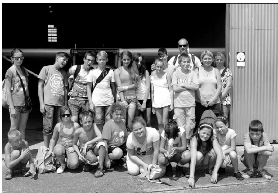
Csoportkép a jakabszállási repülőtéren