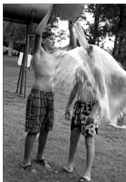
Jeges challenge – hűsítőként