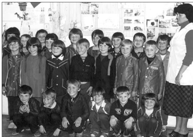
Első osztályosok az 1982-83-as tanévben