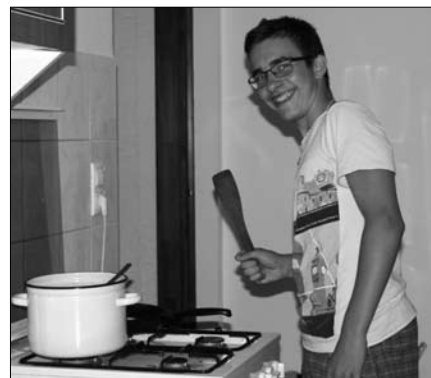
Sül a palacsinta