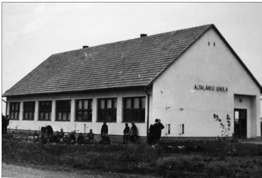
így nézett ki az „új” iskola az 50-es évek közepén.