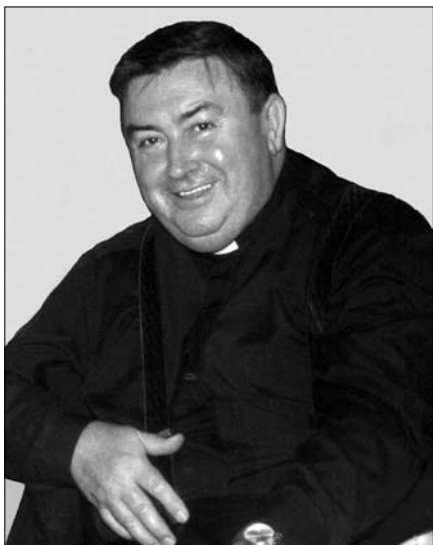
Gyászoló Családtagok, Paptestvérei és Barátai Mihály Atyának, Kedves Szentkirályiak!

Nehezen viseljük veszteségeinket. Különösen is megvisel bennünket ennek az évnek megdöbbentően sok halálesete falunkban. A megmásíthatatlan helyzetbe nyilván beletörődik az ember, kicsit azért mégis kérdőre vonjuk az Úristent: nem élhetett volna még? Nyilván az egymásnak is, önmagunknak is kívánt/kért erőben, egészségben. Földi időnk végesége olykor nagyon is kegyetlen, szinte brutális erővel állít meg a tennivalók