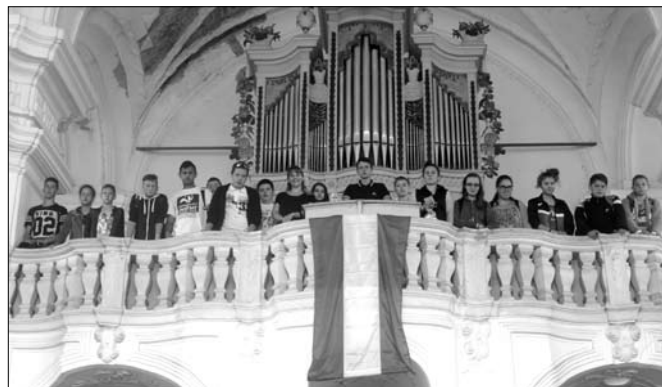
Székely himnusz éneklése a Magyarigeni templomban

A 7. osztály a „Határtalanul!” pályázat keretében kapott lehetőséget, hogy háromnapos erdélyi kiránduláson vegyen részt. A kirándulást rengeteg készülődés előzte meg: filmnézés, önálló felkészülés, power point-bemutatók, előadások, rajzolások, kvizek, totók kitöltése.