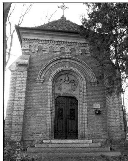
Ferenczy család kriptája Kecskeméten