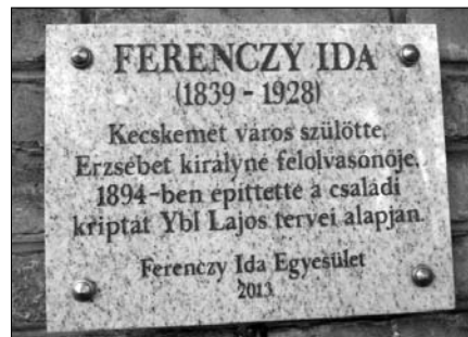
Emléktábla a kriptá bejárata mellett látható

Erzsébet Rend első osztályát adományozta. Ida a császárné halála után Bécsben maradt, összegyűjtötte, rendszerezte Erzsébettel kapcsolatos tárgyi emlékeket, relikviákat, majd egy múzeumot hozott létre a budai Várpalotában 1908-ban. A királyné halálát követően az ő emlékének élt tovább, ezért létesítette az emlékmúzeumot.