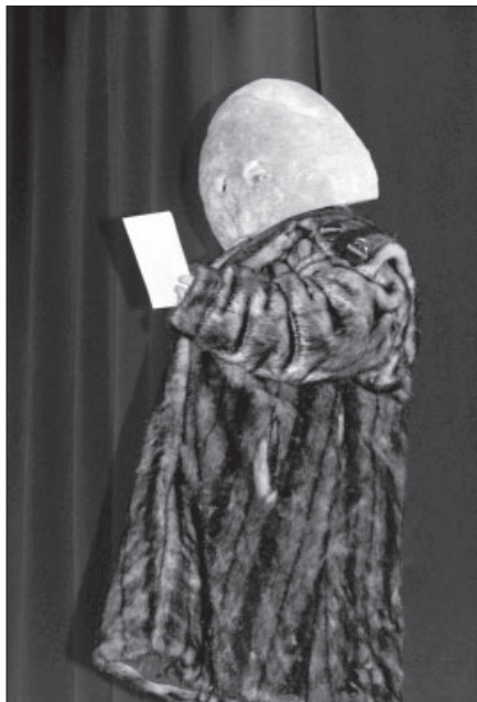
Bundáskenyér szó szerint: bundában, fején fél kenyérral

A Szentkirályi Általános Iskola február 6-án tartotta farsangi mulatságát. Minden osztály színes és szórakoztató műsorral készült, mely után a jelmezesek felvonulása következett.