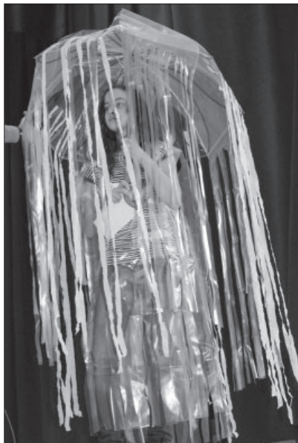
Mutatós és ötletes megoldás a Medúza jelmeze