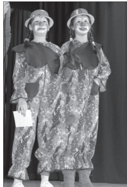
Egyedül nem megy: ezek a Bohócok is így gondolják.