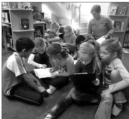
Feladatmegoldás közben a 2. osztály