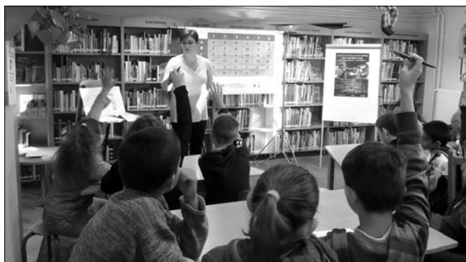
Utazás a tányér körül a 3. osztállyal