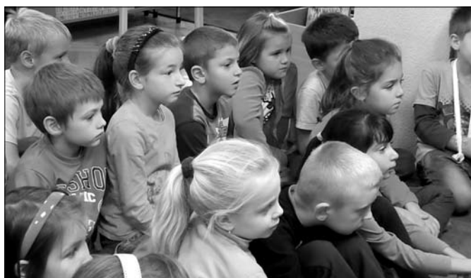
Mesét hallgat az 1. osztály