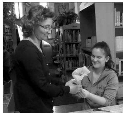
Készül a csuhé virág