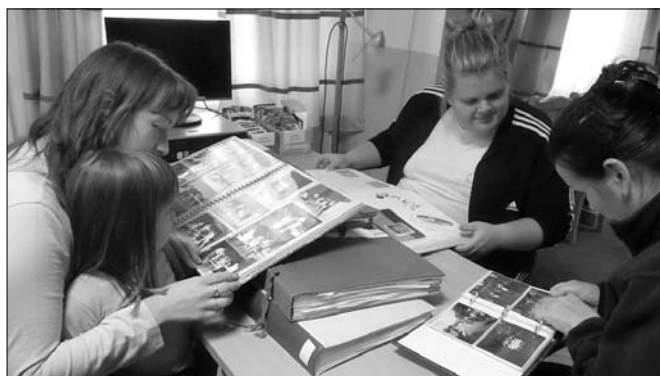
Ismerős arcok keresése