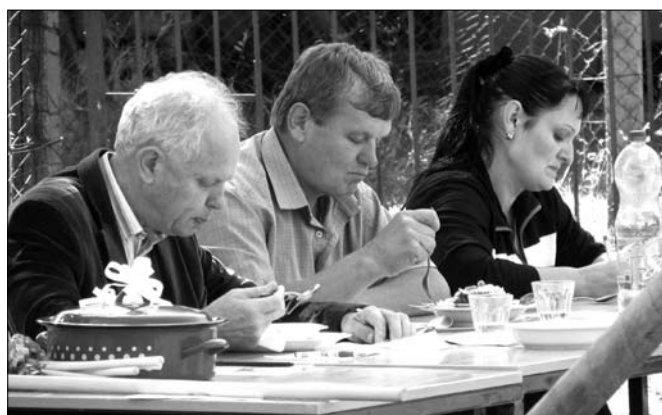
Kóstol a zsűri