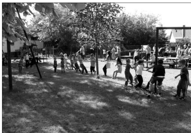
Húzd meg, ereszd meg