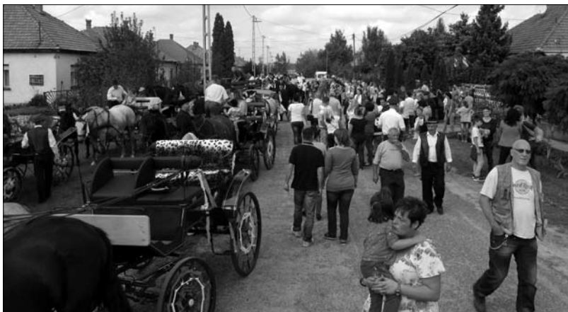
Sokan voltunk az Ifjúság utcában