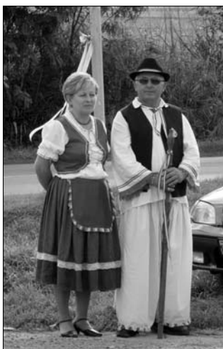
A főbíró házaspár