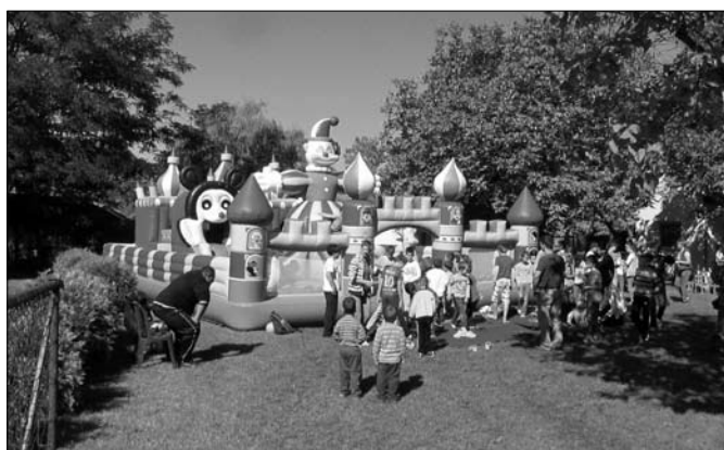
Az ugráló vár az óvodások kedvence volt