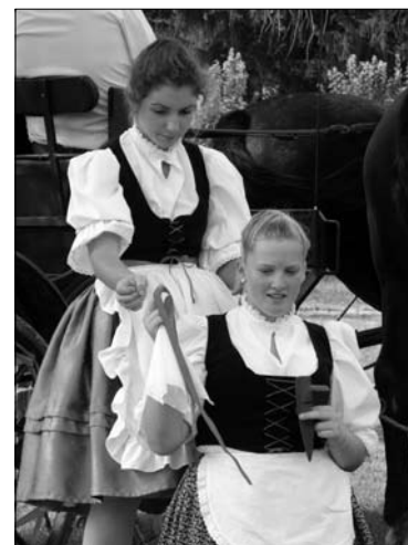
Szépítkeznek a csőszlányok