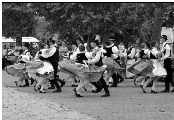
Táncosaink első bemutatkozása piacterünkön volt