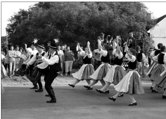
Szép emlékekkel mentek haza az utolsó megállóhelyről, a Kossuth utcából