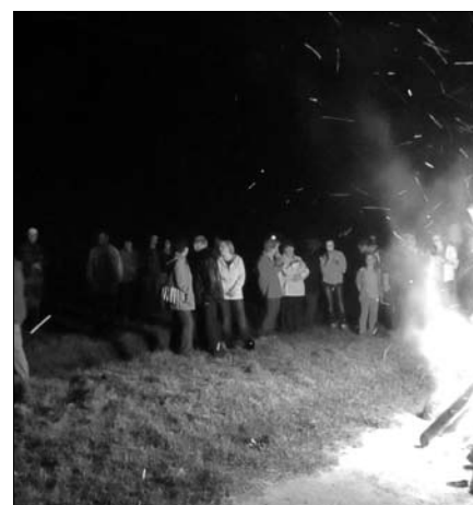
Igazi pásztortűz nótázással