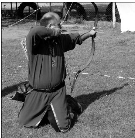
A gyerekek ijál bánni is megtanulhattak.