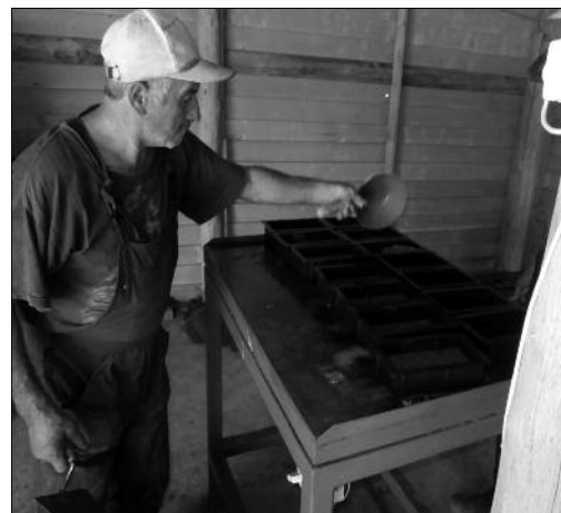
Az öntőformák töltése a rázóasztalon.