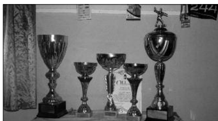
A kupatenger egy kis részlete