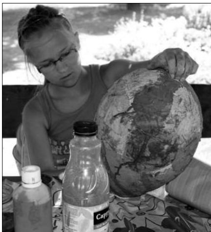
A kézműves foglalkozások egyikén ilyen festett lufifej készült.

Az idei napközis tábor az idén is három hétig tartott a szentkirályi iskolában. Ezidő alatt több mint 50 tanuló vett részt a tábor munkájában, ami leginkább kézműves foglalkozásokból, kirándulásokból és strandolásból állt. Az idén is nagy sikere volt az „ottalvós estének”, melyet éjszakai túrával színesítettek a pedagógusok.