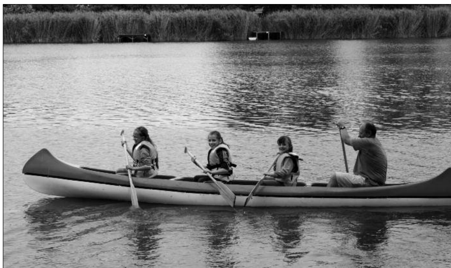
borús idő ellenére az idén is volt evezés Tiszaugon