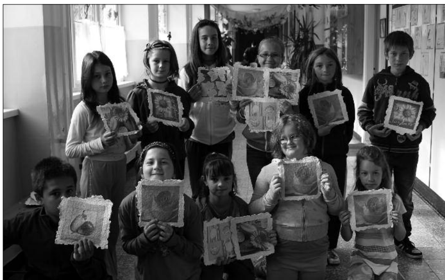
Nagyon szép szalvétaképek készültek