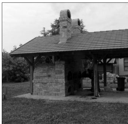
A kész kemencék