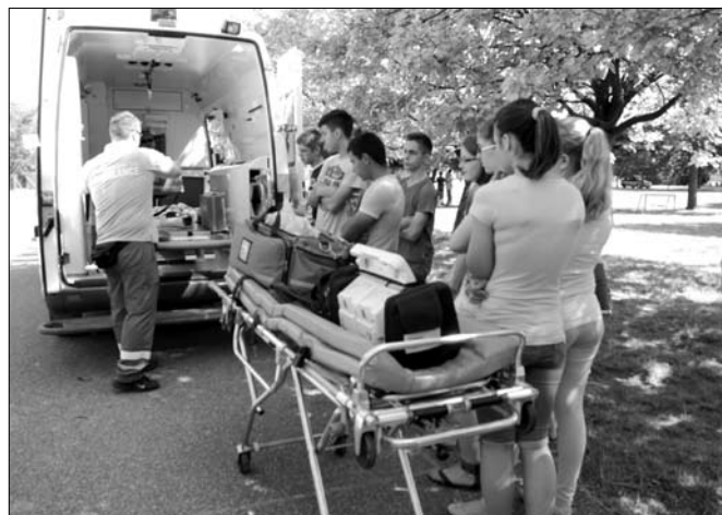
A mentőautó felszerelésével is ismerkedtek a diákok