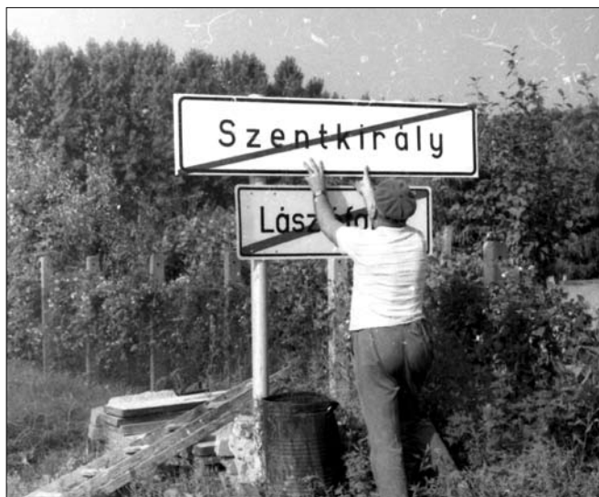
1987. Augusztus 19. Helységnevtábla cseréje.