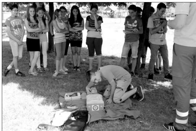
Szakember irányításával gyakorolták az újraélesztést a gyerekek

A június 10-én megtartott egészségnap céljai között szerepelt a környezettudatos, egészséges életmód iránti igény felkeltése és a tanulók ismereteinek bővítése.