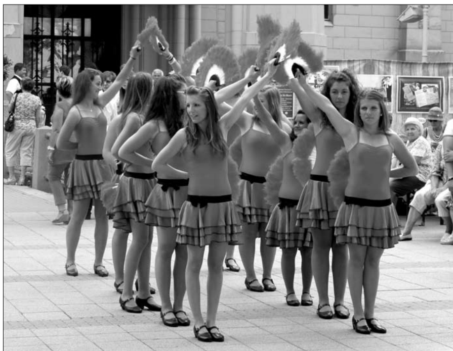
Kezdődik a Szentkirályi lányok tánca, melyet sokan megnéztek