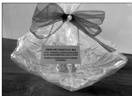
A külön díj