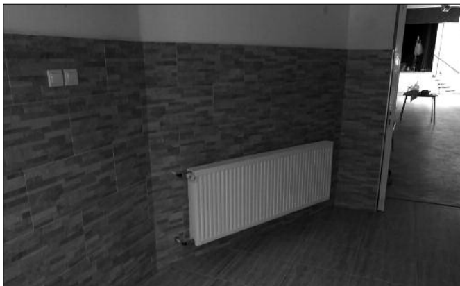
Az előtér új arculata

A Szentkirályi Vágó János Gazdakör évek óta stabil partnere az Önkormányzatnak. Az elmúlt időszakban több közösségi fejlesztés is (Faluház felújítás, játszótér bővítés, vibrációs lapzömítógép beszerzése) a Gazdakör beruházásában valósult meg. Ennek az együttműködésnek legfrissebb példája a Művelődési Ház felújítása.