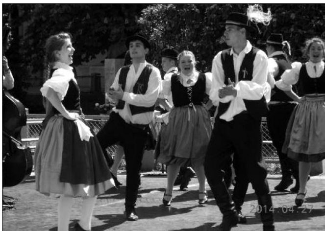
A Szentkirályi táncosok nagy sikert arattak

A színvonalas és sokrétű rendezvény idén is jó hangulatban zárult, s a szervezők remélik, hogy jövőre még több partner bevonásával tárhatják a látogatók elé a térség értékeit.