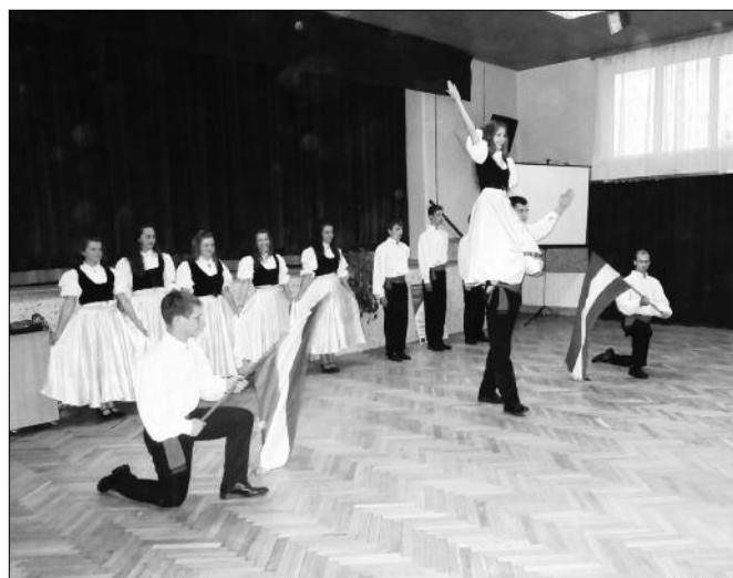
Táncosaink műsorral köszöntötték a felújított művelődési ház megnyitóján résztvevő vendégeket