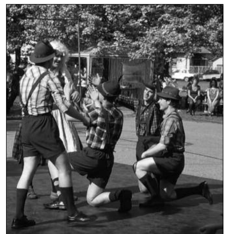
Vidám Tiroli táncsal mutatkozott be tánccsoportunk