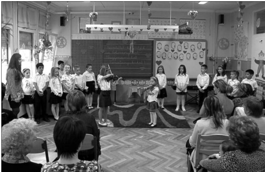
Általános iskolánk első osztályos tanulói műsorral köszöntötték az édesanyákat.