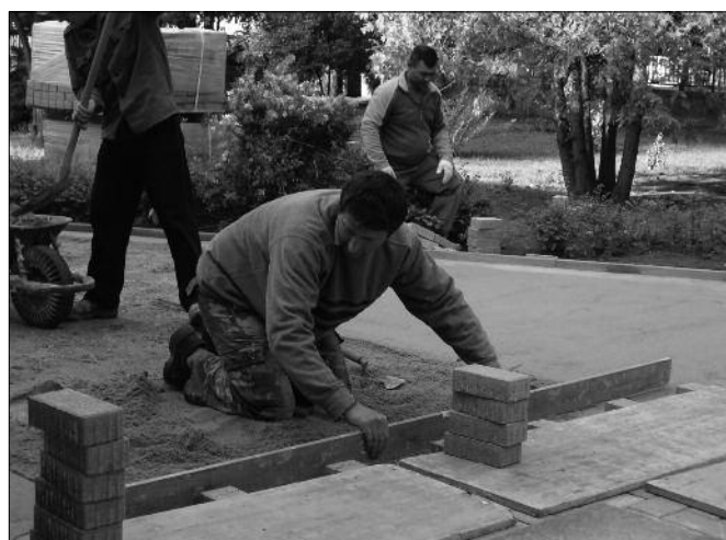
Befejezéséhez közeleg a térburkolat felújítása