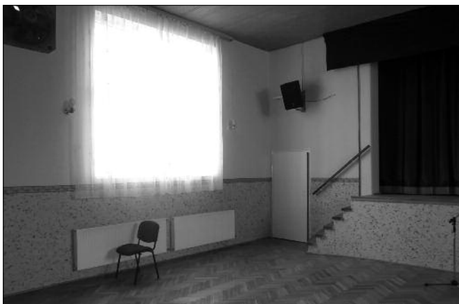
A felújított nagyterem