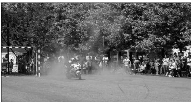
Motorosok, ha találkoznak