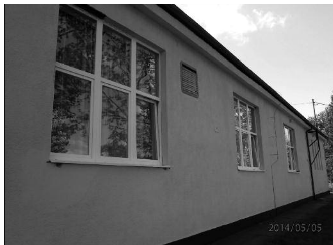
Új ablakok az északi homlokzaton

Kacsolódó beruházásként saját forrás felhasználásával az Önkormányzat korszerűsítette még a ház fűtési rendszerét, illetve lecserélte a nagyterem lambériáját. Az eszközbeszerzések ugyan még részben folyamatban vannak, de a ház ünnepélyes átadása 2014. május 7-én este már megtörtént.