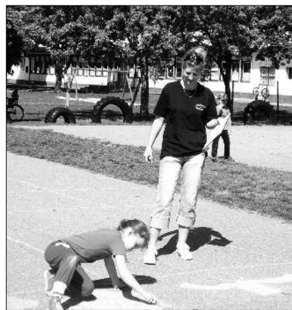
Készül az aszfalt grafika