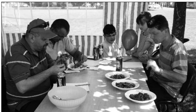
Kóstol a zsűri