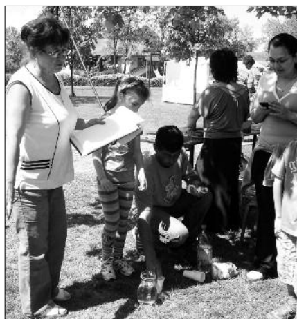
„Széduletes” ügyességi játékokon nagy volt az érdeklődés