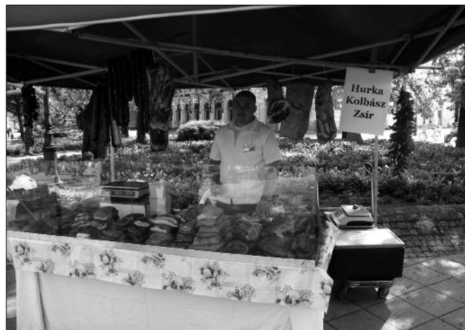
Ínycsiklandozó hentes árúk