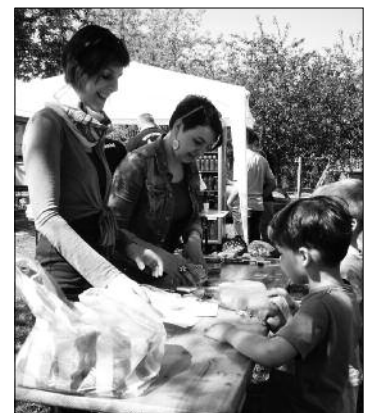
Játékos feladatokat kellett megoldani a gyerekeknek