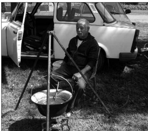
Lángos Anti is finomat főzött