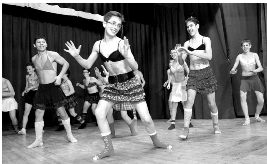
A 8. osztályosok csoportos produkciója