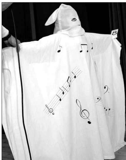
A szolfézs szelleme