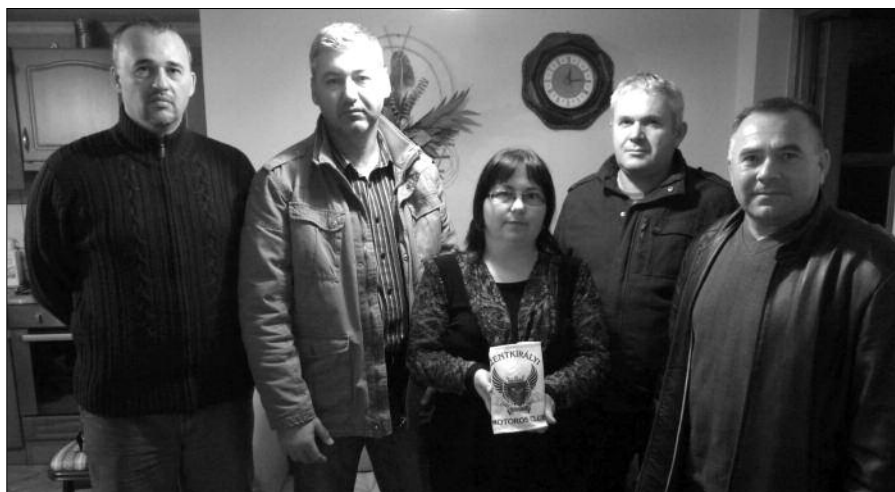
Az átadásnál négyen képviseltük a klubbot

November elején egy nagykovácsi klubtársunk nagyon súlyos közlekedési baleset véletlen áldozata lett. Azóta is, és sajnos még nagyon sokáig orvosi kezelésre fog szorulni maradandó egészségkárosodása mellett.