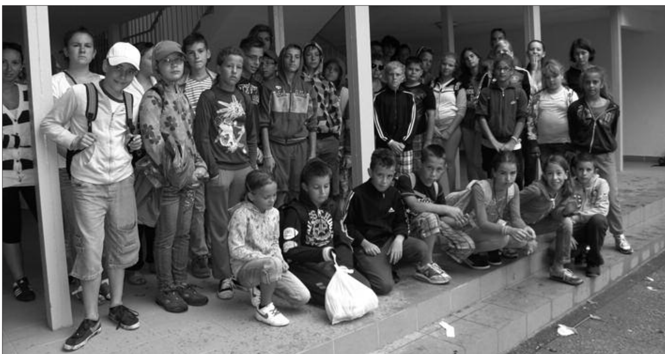
Csoportkép indulás előtt