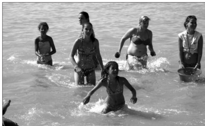
"Vízidili": a vízbe dobált labdákat lavórban kellett összegyűjteni