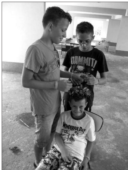
Az Erzsébet-vetélkedőn középkori fejdíszet készítettek a gyerekek

Szó szerint és átvitt értelemben is felhőtlen napokat töltöttünk a Zánkai Erzsébet-táborban augusztus 5. és 10. között, 40 gyerek és 4 pedagógus. Amikor a rádióban is azt hallottuk, hogy most csak vízparton lehet kibírni, mi öt forró napon át élvezhettük a Balaton hűsítő vizét! Az ellátás fantasztikus volt, a szállás kényelmes, a programok színesek és változatosak. Reméljük, jövőre is lesz lehetőségünk táborozni az Erzsébet-program támogatásával.