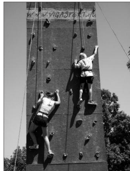
A kalandparkban mászófalon is kipróbálhatták magukat a gyerekek