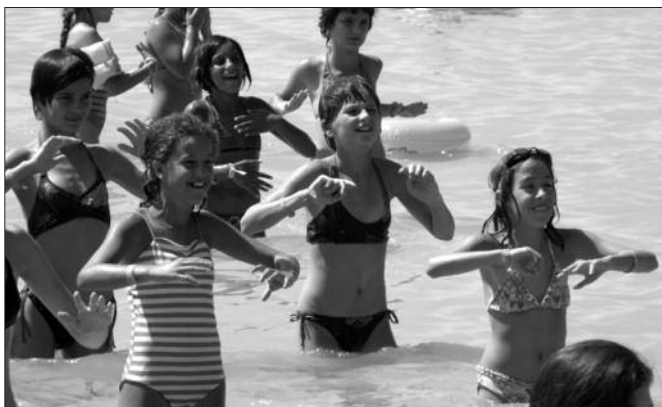
Vízi aerobic minden délután volt