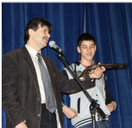
Vendégünk a híres karabély működését is megmutatta

A nagy fejedelem virágoktól roskadó sírjáról készült képet látva sokunkban megfogalmazódott a gondolat, hogy egyszer majd Kassán mi is letegyünk egy szál virágot II. Rákóczi Ferenc és Bercsényi Miklós sírjára.