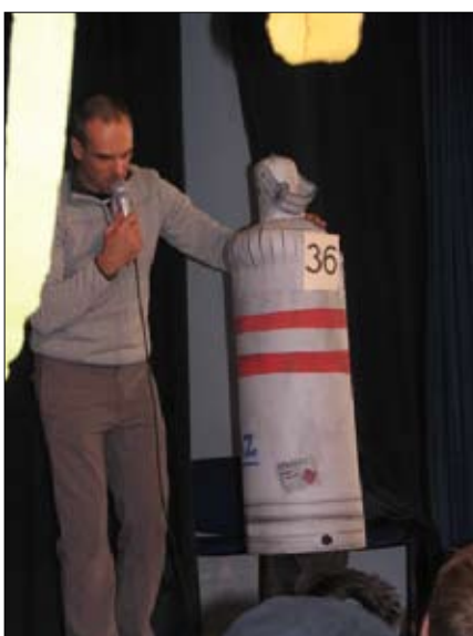
Egy ötletes jelmez a sok közül