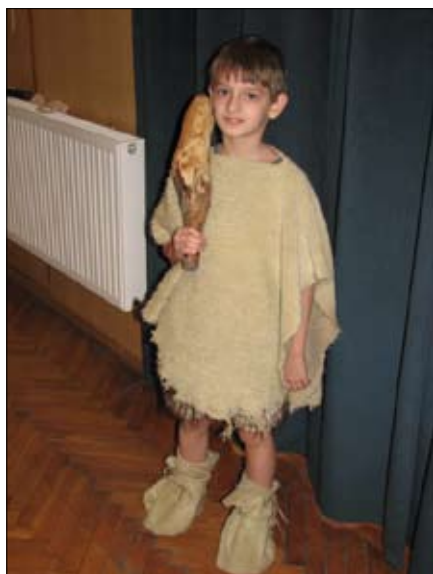
Őseber az ő bunkójával