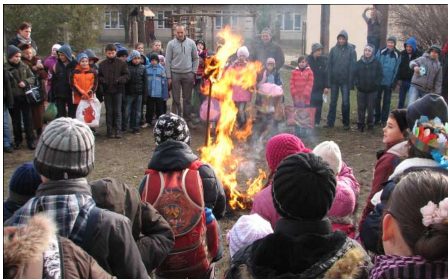
Ég a banya, múlik a tél!