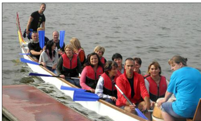
A sárkányhajó legfontosabb utasa a dobos, itt háttal látható

azt is megállapítottuk, bizony mi már történelmi időket is megéltünk. A sárkányhajózásról pedig nem is lehet írni, azt mindenkinek ki kell próbálni!