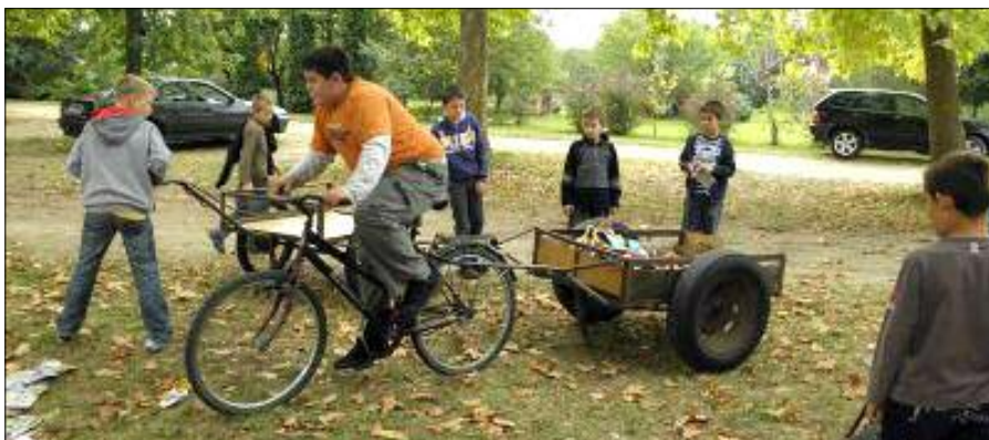
Jól jön ilyenkor egy utánfutó

Az idén is lezajlott a papírgyűjtés, s mivel az előző években már mindenki leporolta a padlást és kitakarította a pincét, az idén kicsit kevesebbet nyomott a mérleg. Köszönjük mindenkinek a segítséget, és már most bejelentkezünk a jövő évi papírért!