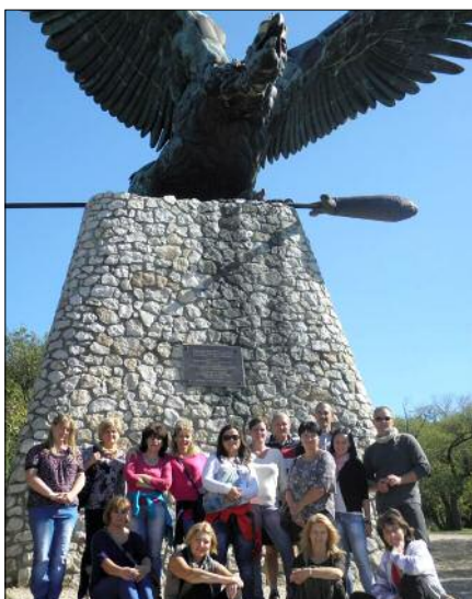
Tantestületünk a Turul madár előtt

Jó társaságban, szép környezetben gyorsan telik az idő. Így éreztük ezt szokásos tantestületi kirándulásunkon az idén is. Tata és Komárom volt az úticélunk, a reggeli eső pedig csak korai vendég volt, és nem sokáig maradt. Szinte nyári melegben túráztunk a Turul madárhoz, és jártuk végig a szebbnél-szebb tait nevezetességeket. A komáromi Monostori erődben igazi történelem óra volt számunkra, és