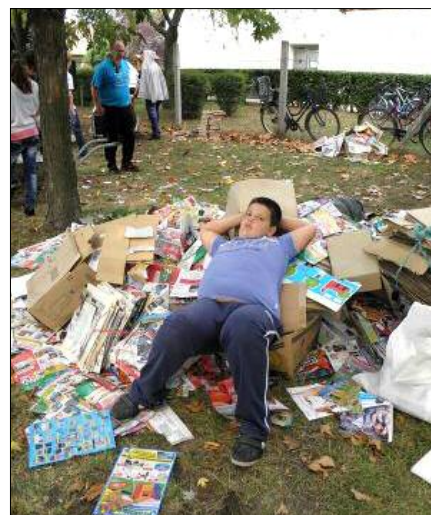
Jól végzett munka után kell a pihenés, és vigyázni kell a zsákmányra is!