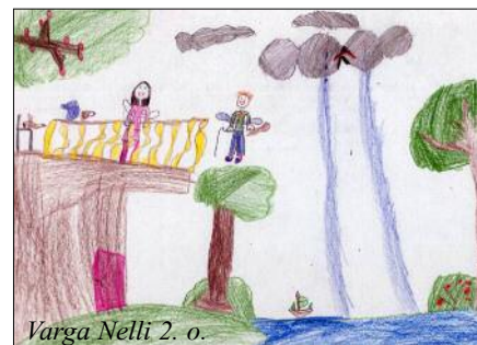
Varga Nelli 2. o.