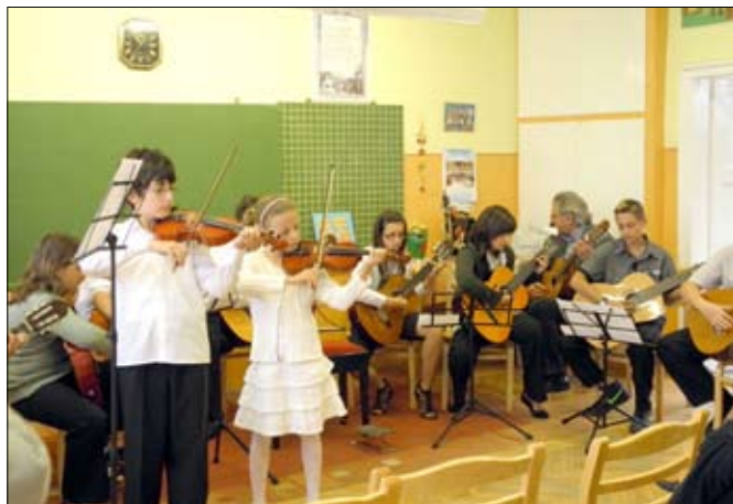
Hegedűsök és gitárosok közös produkciója

A Szentkirályi Zeneiskola több tanszakán már megtartották az év végi vizsgákat. A nagyszerű egyéni produkciók mellett az idén már zenekari produkciókat is hallhattunk, láthattunk.