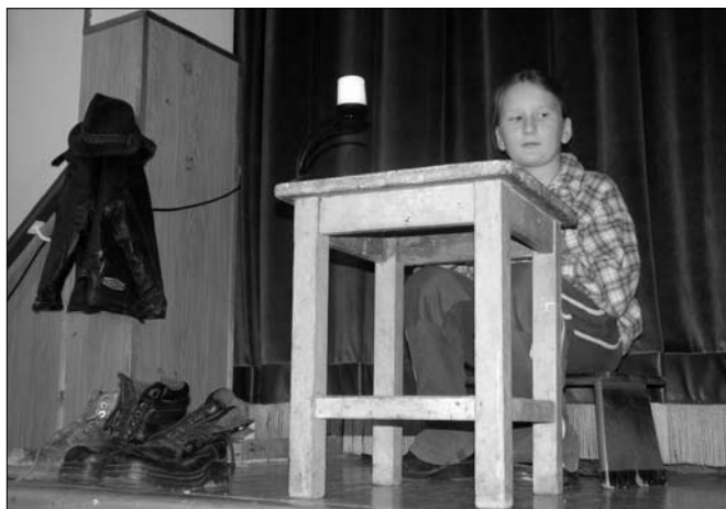
Híába nagy a szegénység, a szuster nem adja egyik gyermekét sem