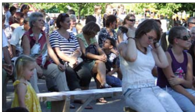
És a közönség.