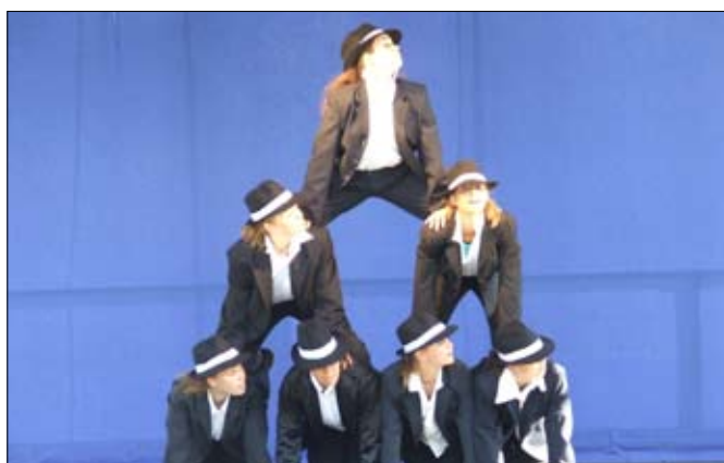
A Fülpötházi Szivárvány táncgyűttes egyik produkciója