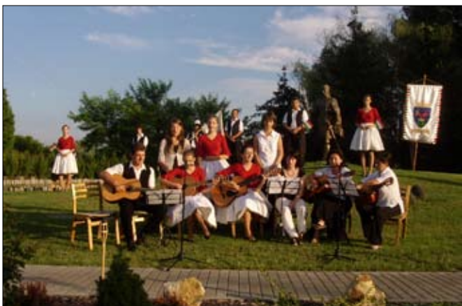
A Szentkirályi gitárosok Szent István szobrunknál.