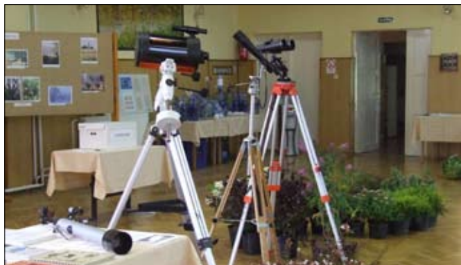
Csillagászati eszközök kiállítása a művelődési házban.