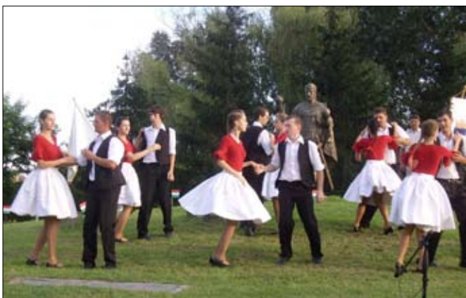
Mint minden ünnepről, innen sem maradhatott el táncsoportunk műsora.