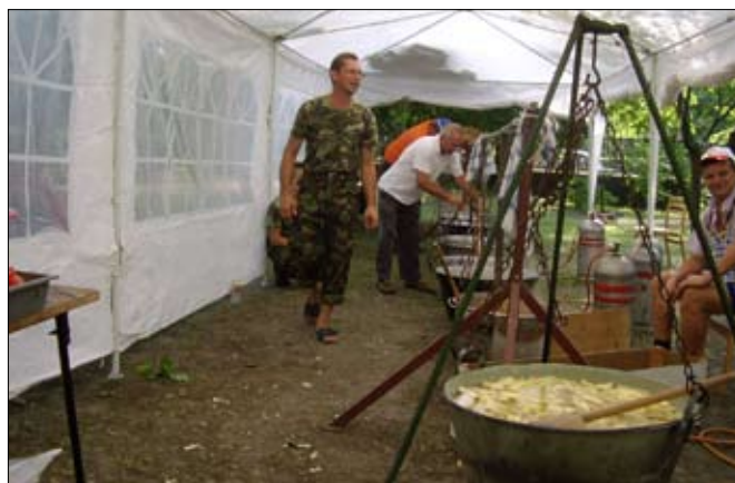
Készül a finom vacsora.