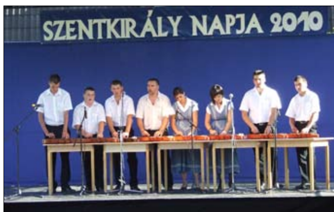
A Kunbaracsi „Kökény” citerazenekar már nem először járt nálunk.