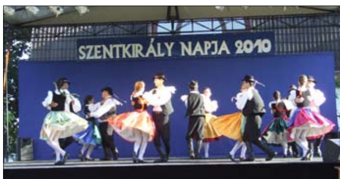
A „hazai” táncosok