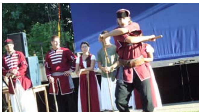
A barantások Hetényegyházáról érkeztek és pásztorsz- közökkel „virtus” játékokat mutattak be.