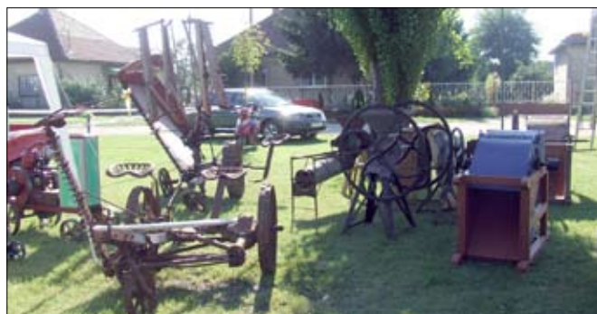
Varga Imre gépkiallításának egy részlete.