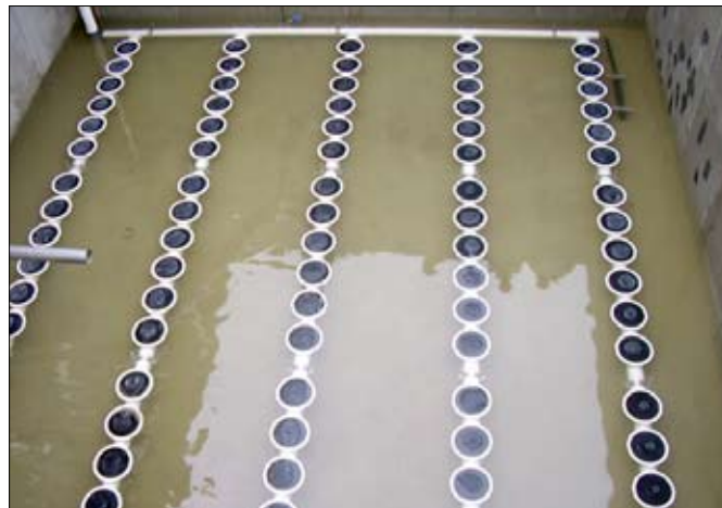
Így néz ki a medencék szellőztető rendszere.