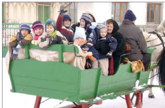
Szánkós túrán az óvodások.