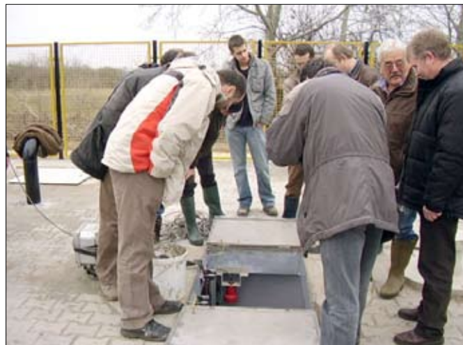
A Szent István téri átemelő telep szemléje.