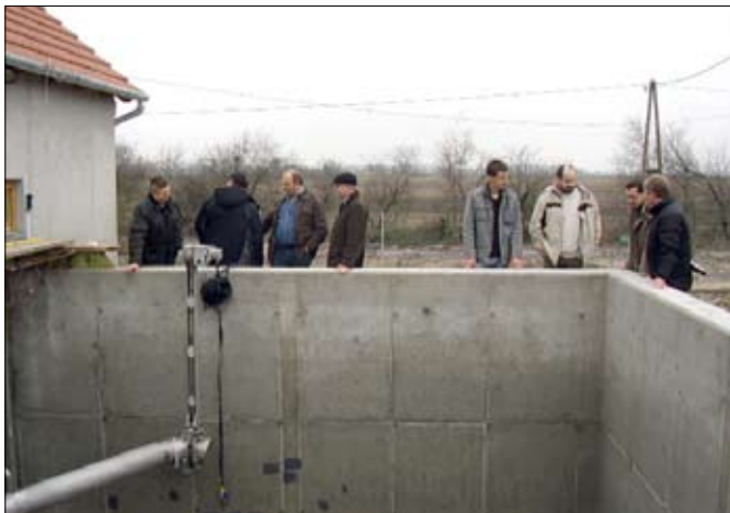
Műszaki szemle az egyik medencénél.