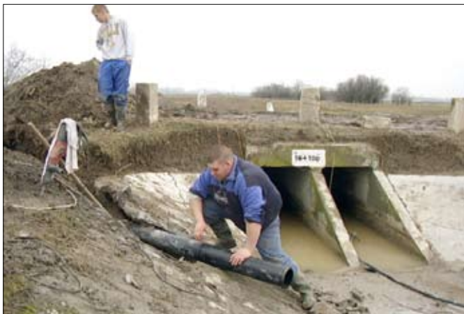
Szennyvíz hálózatunk legtávolabbi pontja. Csatlakozás a Peitsik csatornába szerelés közben.