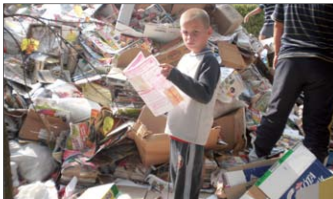
Nemcsak gyűjtöttük, olvastuk is!