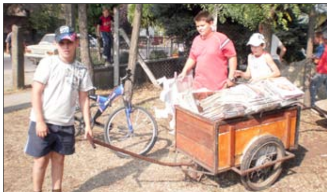
Ilyenkor nagyon hasznos a megfelelő jármű!