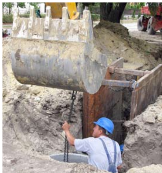
Készül a tisztító telep.

életét sokáig szolgáló, kiváló minőségű csatornahálózat és tisztítómű épüljön.