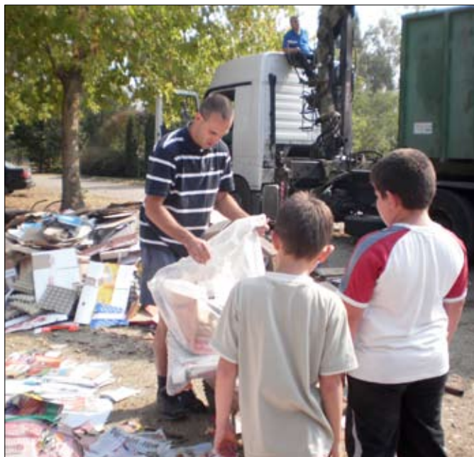
Tanár-diák egyformán dolgozott!

Köszönet mindenkinek, aki segítette a gyerekeket a papírgyűjtésben.