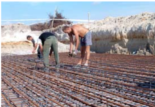
Betonvas rengeteg kétméteres mélységben.

A Dél-Alföldi Operatív Program keretében Szentkirály Község Önkormányzata szennyvízcsatornahálózat és helyi szennyvíztisztító telep létesítésére nyert támogatást. A beruházás szeptember elején vette kezdetét, és várhatóan 2010. február végére be is fejeződik. Ekkor kezdődik majd a hathónapos próbaüzem.