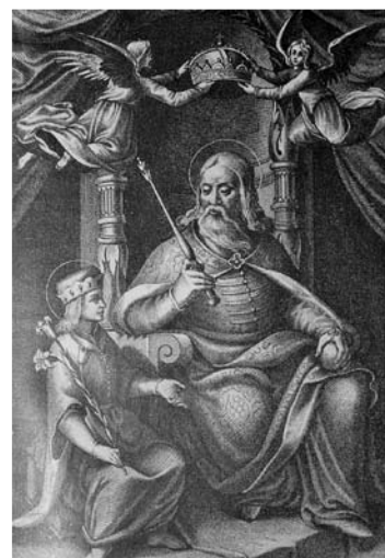
Szent István király fiával, Imre herceggel.