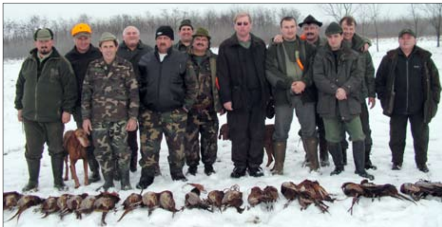
Sikeres volt a fácánvadászat.