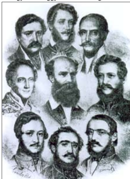
Az első felelős magyar kormány, mely a márciusi forradalom hatására alakul.

A felvonulók délután pedig kiszabadították börtönéből a politikai okok miatt elítélt Tancsics Mihályt. A tüntetés idején és a szabadító akció során a hatalom nem gördített akadályt a tömeg útjába. Így elmondható, hogy a pesti fiatalok és a tüntető tömeg jelentős sikereket ért el a reakció ellenében. A magyar országgyűlés küldöttsége ebben az