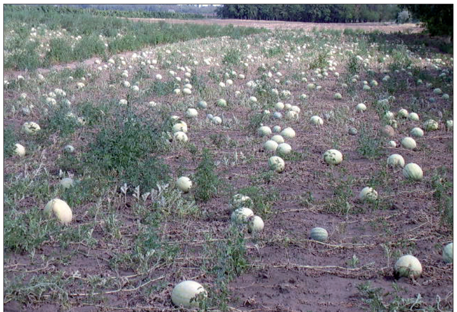
Szomorú látvány: a kifehéredett dinnyék.