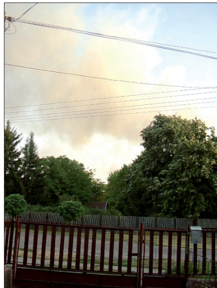
Ég a nyárlőrinci fenyves.

döntéseit. Visszatérve a fenyvesek tüzeseteihez, ha szándékos gyújtogatás nem is történt, azért az emberi gondatlanság közvetett módon hozzájárult. Az elmúlt évtizedek, évek mértéktelen szemetelése, melyek súlyosan érintették az erdőket. A szétdobált üveg palackok mint gyújtó bombák hevernek erdőkön, mezőkön. Csak megfelelő meteorológiai feltételek kellene, és a gyújtólencseként működő palackok, üvegdarabok lángra lobbantják