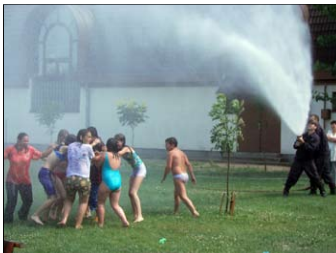
Senki sem úszta meg szárazon a tűzoltóság locsolkodását.