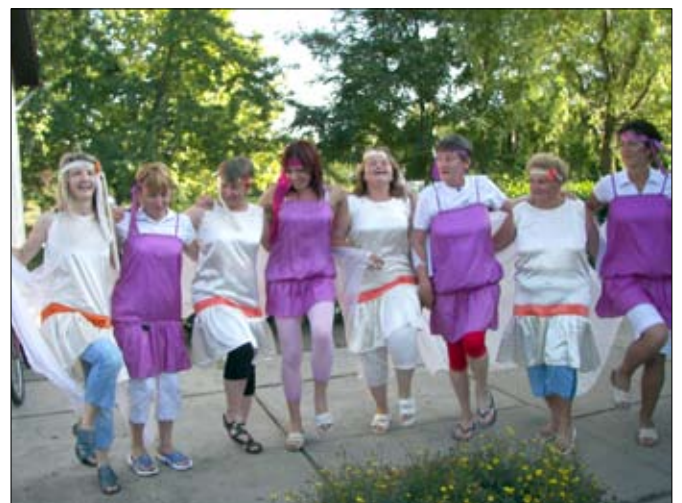
Vidám hangulat a tanári kart se kerülte el.