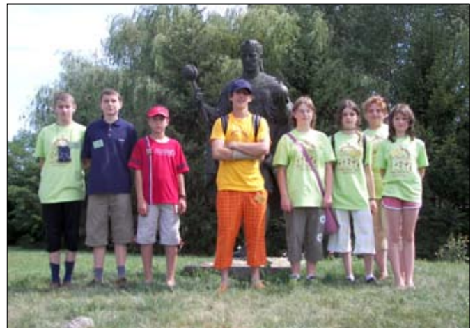
A Kalota szentkirályi csoport a Szent István szobrunk előtt.