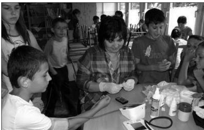
Fontos a vérnyomás ellenőrzése