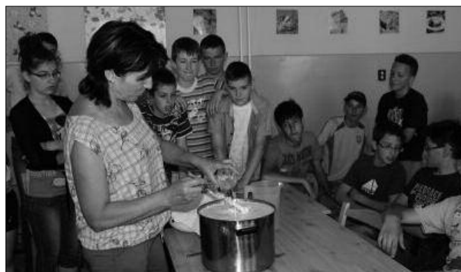
Ebből lesz a sajt!