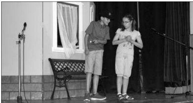
Peti és Tina kalandot keresnek, és találnak is

Az előadás a TÁMOP 3.2.3./A-11/1-2012-0035. sz. Építő közösségek projekt támogatásával jött létre.