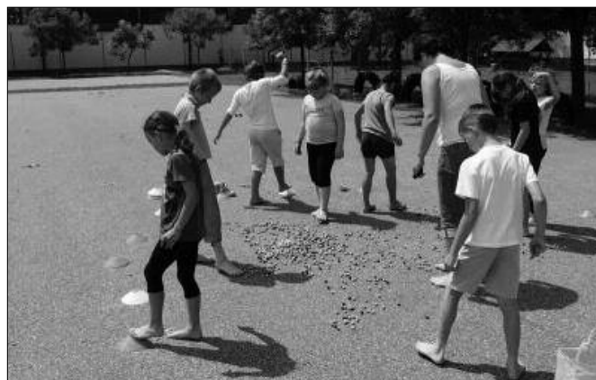
A golyókat a lábujjakkal kellett összeszedni