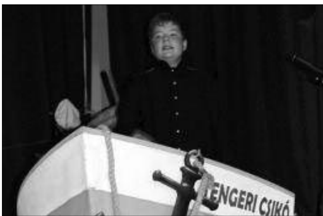
A Tengeri Csikó és bátor kapitánya