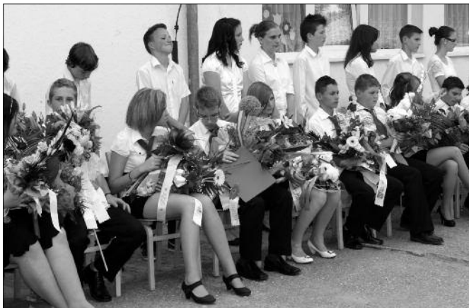
A ballagók egy csoportja

Az idén 23 nyolcadikos tanuló búcsúzott a Szentkirályi Iskolától. Sok sikert kívánunk nekik a további tanulmányaikhoz!