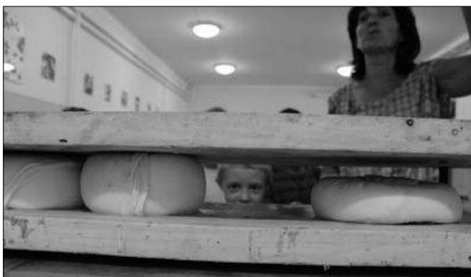
A sajtok között egy kíváncsi szempár