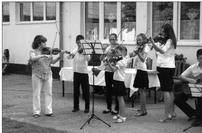
Az ünnepségen színvonalas műsort adtak az iskola tanulói. A képen a zeneiskola hegedű tanzakos hallgatóinak egy csoportja látható.