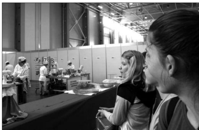
A gyerekek közelről láthatták, hogyan dolgoznak a cukrászok