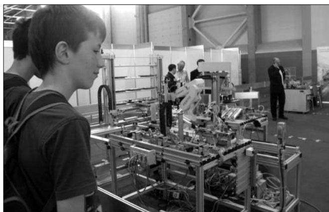
A fiúkat jobban érdekelték a műszaki dolgok