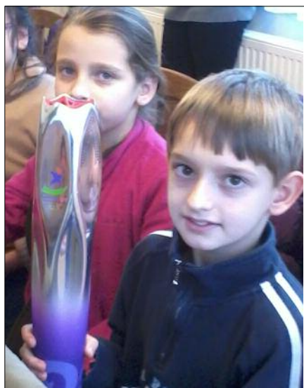
Az olimpia láng