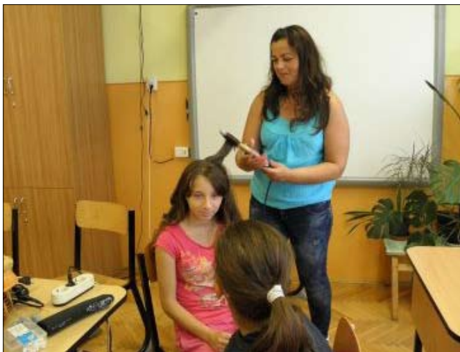
A szépségszalomban sokan megszépültek