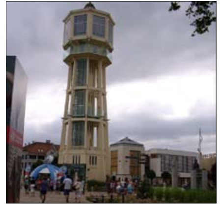
A víztorony felső szintjeiről csodás a kilátás.