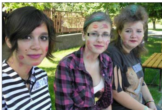
Az idén is vicces-bolondos ruhákban, kifestve, jelmezekben vonultak végig a falun a bolondballagók.