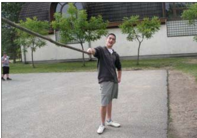
Nem is volt olyan könnyű Toldi Miklós dolga

Az idén is izgalmasan és szórakoztatóan telt a gyereknap. Lehetett jelentkezni a 40 milliós játékra, az Egy perc és nyersz játékra, be lehetett ülni a presszóba, lehetett tetováltatni, házasságot kötni, dalt küldeni ... és még nagyon-nagyon sok mindent! De semmi sem volt ingyen, hiszen ezeket tallérért lehetett megvásárolni, melyekhez ügyességi játékokon lehetett hozzájutni.