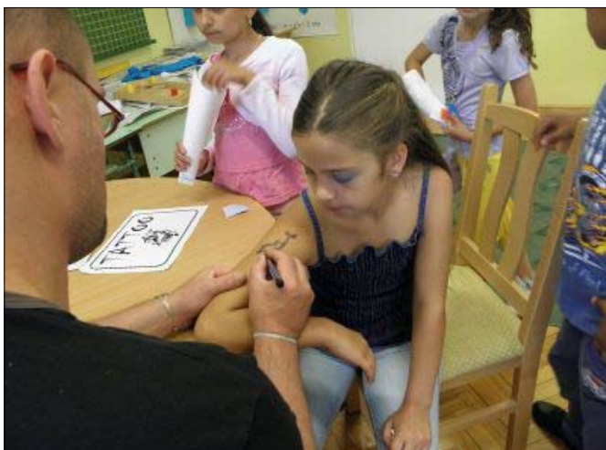
A tetováló műhelyben mindig volt vendég