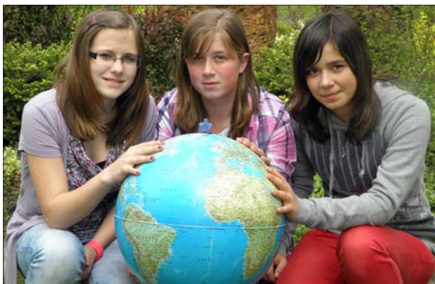
A „Kukabúvárok” csapata az I. helyen fejezte be a versenyt.

Április 27-én a Tiszaalpári Árpád Fejedelem Általános Iskola által meghirdetett XII. Kistérségi Természetismereti Versenyen vettünk részt, három korcsoportban – 3 fős csapatokkal.