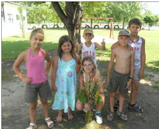
Vadvirággűjtés után csokor-szépségversenyt rendeztünk