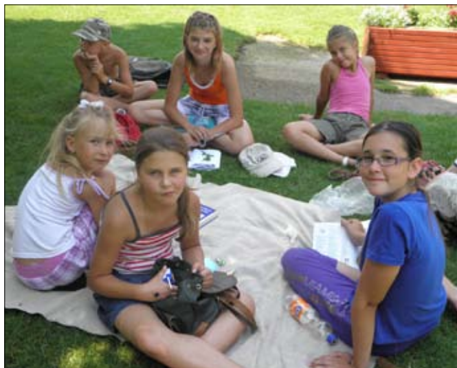
Túra után jól esett a pihenés