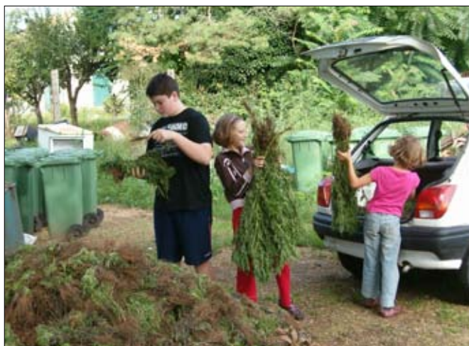
Parlagfű számlálás a kerékpárért

Szélsőségekben igen gazdagon telt el a hónap. Az első napok kicsit hűvösesek voltak, azonban egy hétre rá már hőmérsékleti rekordok dőltek meg. Olyan igazi aratásra való idő volt. Közel tíz napig tartotta magát az igen meleg. Aki ekkora nem tudta befejezni a gabonák betakarítását, már csak igen nagy veszteséggel és költséggel tudta elvégezni. Aztán 20-án orkán erejű, fákat kicsavaró széllel, kevéske esővel, hűvös levegő érkezett, ami a hónap végéig vendégeskedett már-már erősen őszi idő látszatát keltve. Csapadékos nap került bőven, azonban néhány esettől eltekintve csak inkább munkarontónak lehetett nevezni.