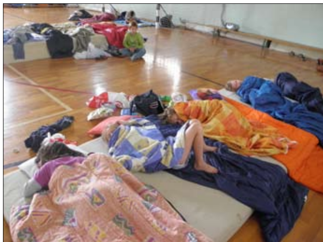
Az „ottalvós” este újdonság volt az idei táborban