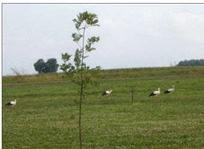
Fiatal gólyák tanulnak „egerészni”

Július végére, augusztus elejére a gólyafiak-lányok elhagyják a biztonságot adó fészket. Több heti szárnypróbálgatás és edzés után szüleik után erednek. Egyre hosszabb utakra vállalkoznak, naponta akár több száz kilométert is megtesznek, egyre magasabbra emelkednek. Az első napokban a földre nem szállnak le, mert onnét nehezen tudnak még felemelkedni. Persze itt meg kell jegyezni, hogy a fészekben elhízott fiókáknak nehezebbre esik a repülés. Ekkor még szüleik rendszeresen meghatározott időben, élelemmel megrakottan térnek haza biztosítva az ifjoncoknak a gondtalan életet, mely már csak pár hétig tart, és addig meg kell tanulni önállótóknak lenni. Fel kell ismerni az élelemben gazdag helyeket. Meg kell tanulni elfogni pockot, egeret, békát, tücsköt. Meg kell tanulni tájékozódni. A hónap közepén aztán óriási csapatokban gyülekeznek, hazai földön vándorolnak. Érdekes, hogy ekkor még akár 100 km-ről is hazajönnek éjszakára. Augusztus végére aztán nyomuk vész. Eddig csak feltételezni lehetett, hogy hol járnak,