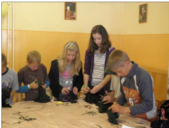
A batikolás a fiúknak is tetszett