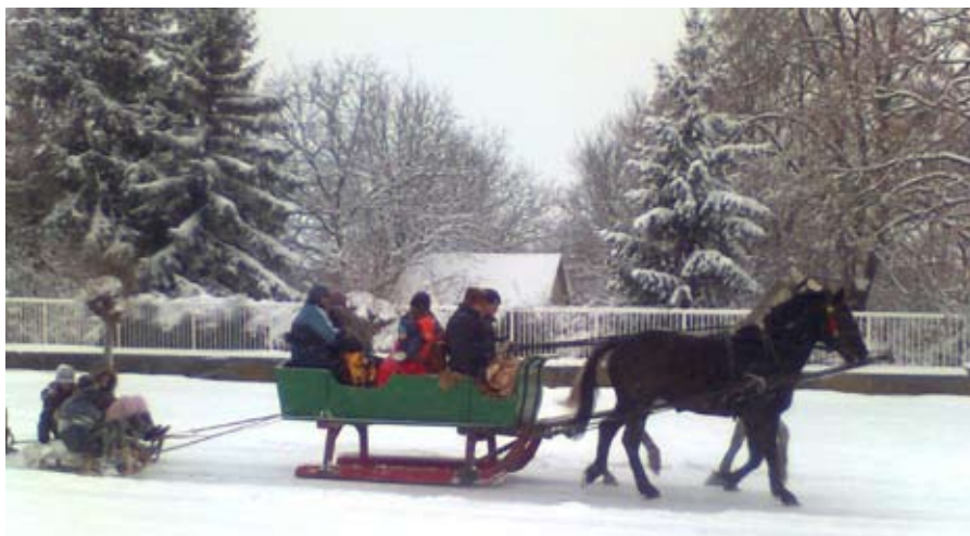
Karácsonykor frissen esett hóban már szánkózni is lehetett.

Kolontár település lakossága nevében köszönetünket fejezzük ki Szentkirály lakóinak, támogatóinak."