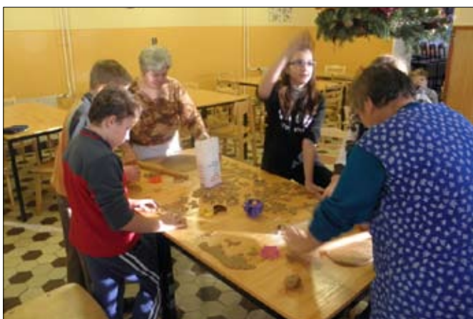
A mézeskalács-sütésnél jól jött a nagymamák segítsége

Köszönjük, hogy elfogadták meghívásunkat, és tevékenyen segítettek rendezvényünkön!