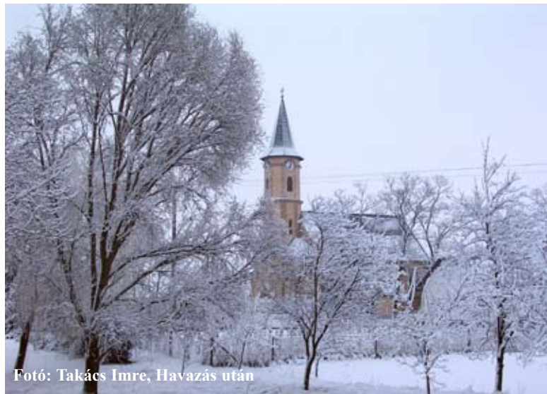
Havazás után