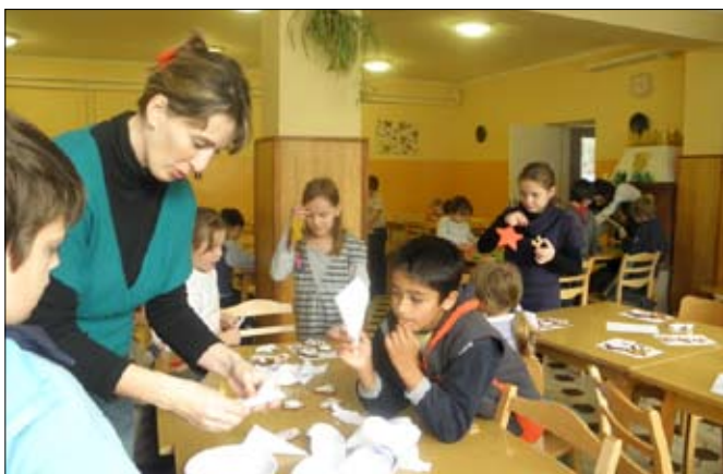
A fiúk sem csak ették a süteményt, hanem díszítették is.