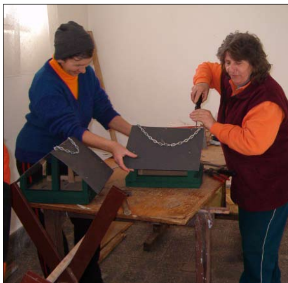
Készülnek az etetők

Az utóbbi években elszoktunk a hosszan tartó igazi télies napoktól. Az emberek csak-csak megoldják a hideg előli menekvést, vadon élő állatoknak azonban elkél a segítség.