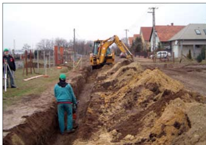
Csatornázási munkálatok az Arany János utcában