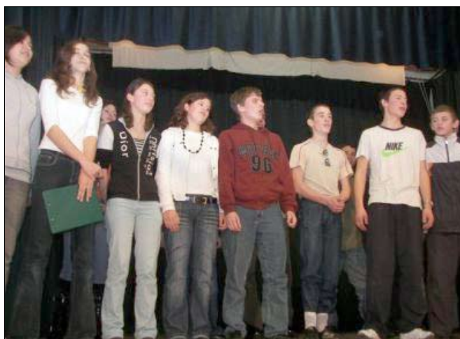
Nekik már másutt kell bizonyítani!

- Kezdetől fogva jól éreztem magam, nagyon tetszett a gólyatábor és az iskola sem okozott csalódást.