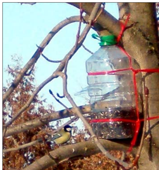
Szorgalmasan látogatják az etetőket a cinkék.