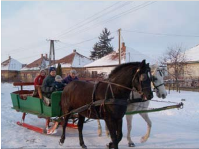
Az igazi tél látványa a lovas szánkó