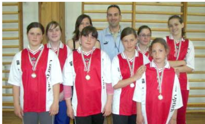
Kézilabda 2.: A II. korosztályos lányok 2. helyezést értek el

Két korcsoportban mérték össze tudásukat a bócsai, jabakszállási, kerekegyházi és a szentkirályi játékosok. A torna végeredményként II. és III. helyezést értek el iskolánk tanulói. Gratulálunk az elért eredményhez!