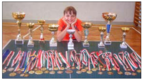
Szaporodnak az érmek és a kupák.