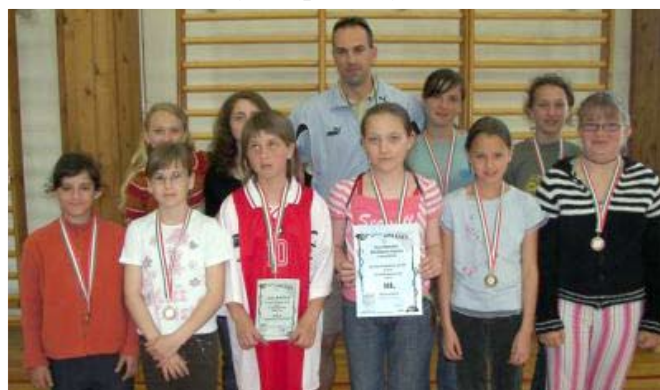
Kézilabda: I. korosztályos lányaink 3. helyezést értek el.