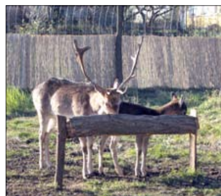
A Mikulás rénszarvasai.