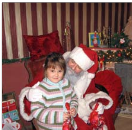
A Mikulás átadja az csomagot.

Az óvodás gyermekek, szülőkkel, dolgozókkal felkerekedtünk, két gyönyörű buszra szálltunk, s meglátogattuk Nagykarcsonyban a Mikulást. Bár az út eleje nem volt zökkenőmentes, de a napunk annál szebbre sikeredett. Elsőként a játszóházat vettük birtokba, 113-an, szinte betöltöttük az egész teret. Csúszdázhattunk, mászókázhattunk, karácsonyi üdvözlőlapot ragaszthattunk, karácsonyi gipsz díszeket festhettünk, és együtt játszhattunk. Olyan sokan voltunk, hogy csak két csapatban fértünk be a Mikulás házába, ahol megdicsérték minket, mennyire összetartó a mi kis társaságunk. A Mikulásnak elmondhattuk verseinket, énekeinket, cserébe mindenkit megajándékozott egy kis csomaggal. Az udvaron felülhettünk a szánjára, megnézhattuk a rénszarvasait. A Mikulás szekrényének titkos rekeszeiből minden gyermek választhatott magának apróságot, és helyére betettük az általunk hozott ajándékokat a következő csoportok számára. A nagykarácsonyi posta előtt olyan szerencsénk volt, hogy láthattuk a Coca-cola karaván indulásra készülődő kamionjait. Fáradtan, de örömmel a szívünkben tértünk haza.