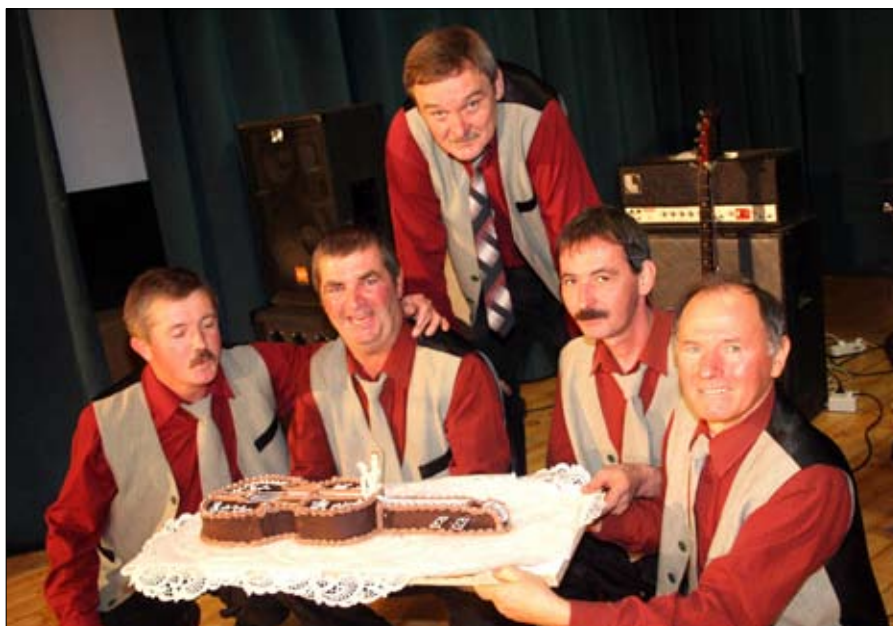
Az együttes tagjai egy gitár alakú tortát kaptak.