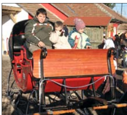
A Mikulás szánkója.