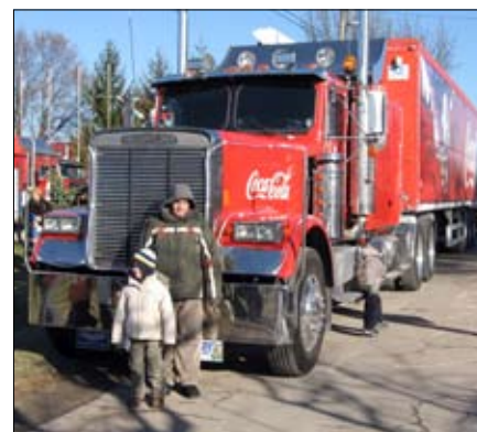
Coca-cola karaván indulásra készülő kamionja.