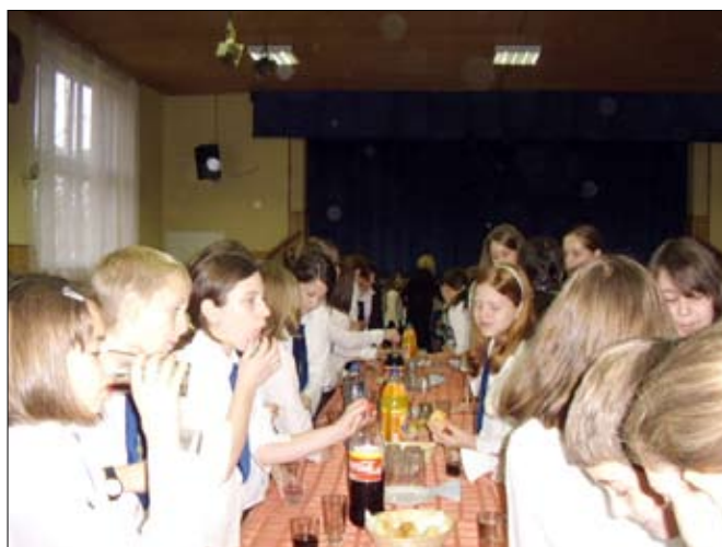
Jól esik az uzsonna a messziről jött vendégeknek.