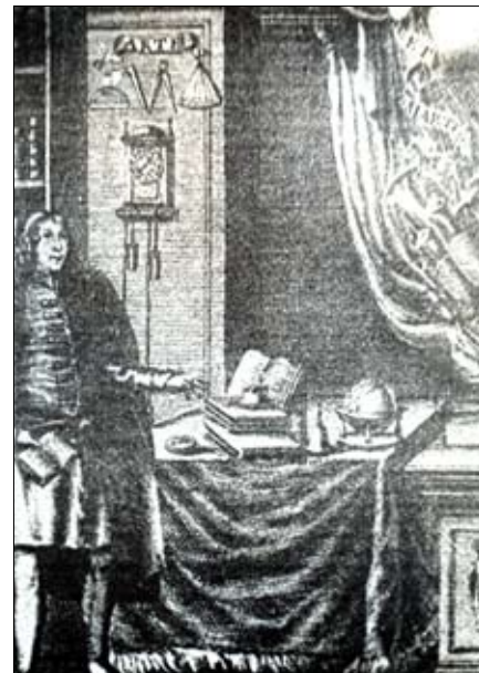
gróf Zrínyi Ádám.

Ahogy élt – ősei hagyományait folytatva -, úgy is halt meg. Hiszen a Zrínyiek a haza ellenségei ellen elég gyakran véreztek. Egyik őse, Zrínyi Miklós 1566-ban Szigetvárnál halt hősi halál, Zrínyi Györgyök sem a párnák között vesztették életüket. Nagybátyját, Zrínyi Pétert a bakó