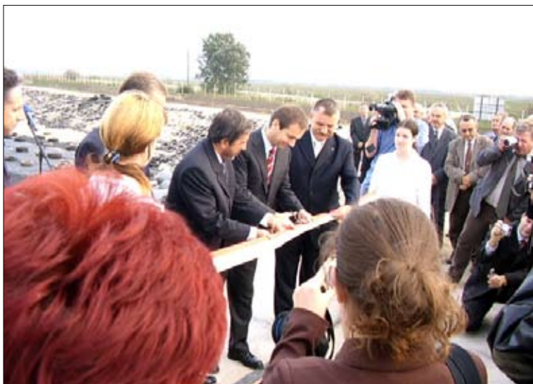
Bajnai Gordon átvágja a hulladéklerakó szalagját.

liárd Ft-ba került. Az üzem a térség háztartási hulladékát „dolgozza” fel. Az éves kapacitása az üzemnek harmincötezer tonna. A hulladékválogató szalagjára ürítik tartalmukat a „kukás” autók, és a másik oldalon már óriási bálákba kötve látjuk viszont, de