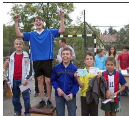
Az atlétikai verseny díjazottai.