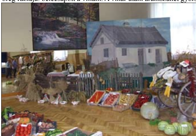
A kiállítás egy részlete

Az idén második alkalommal a Szentkirályi Ásványvíz Kft. rendezte községünk nevezetes ünnepét. Sok ezer látogató érkezett országunk szinte minden részéből. Az ünnepi forgatagot leírni szinte lehetetlen, csak a résztvevők élhették át az ünnepséget, a rendezvény élményeit. A látványos "ökörsütés" hozzátartozott az ünnephez, akárcsak a Szentkirályi táncosok műsora, vagy a Szentkirályért Közalapítvány ösztöndíj-pályázati eredményeinek kihirdetése. Országos sztárok műsoraiból lehetett csemegézni, válogatni. Voltak, akik csak Korda György - Balázs Klári kedvéért látogattak községünkbe, míg mások a NOX együttes fergegetes műsorára voltak kíváncsiak. Persze igyekezett mindenki egyetlen műsorról sem lemaradni. Az éjszaka 11 órás látványos tűzijátékba az ég is belesegitett cikk-cakkos égi firkákkal, melynek szenvedő alanya fizikailag is, a Művelődési Ház kertjének öreg fűzfája: belesapott a villám. A vihar utáni áramszünet gyors