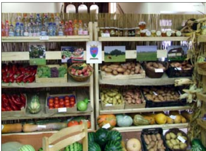
Szentkirályi termények és termékek

Az idén augusztus 28. és szeptember 2. között tizedszer került megrendezésre a "Hírös- hét" Fesztivál Kecskeméten. A főtéren kulturális programok vonzották a vendégeket. Sajnos a Szentkirályi táncosok főtéri bemutatkozását 29-én, elmosta az eső. Szakmai konferenciákon lehetett informálódni az aktuális gazdasági, vagy idegenforgalmi eseményekről, a jövőbeli elképzelésekről. Az Erdei Ferenc Művelődési Központban kapott helyet a Kecskeméti Kistérség tizenhét településének kertészeti és élelmiszeripari kiállítása, bemutatása. A mezőgazdasági terményektől kezdve a bio élelmiszerekig mindent meg lehetett találni. A községek jellegzetes ételeit, italait a települések bemutató napján meg lehetett kóstolni.