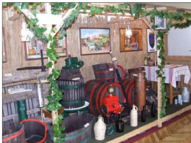
Majdnem pincében érezhettük magunkat