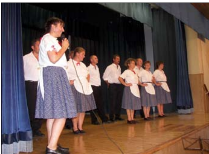
A húsz éves táncosok fogadják a közönség elismerő tap-