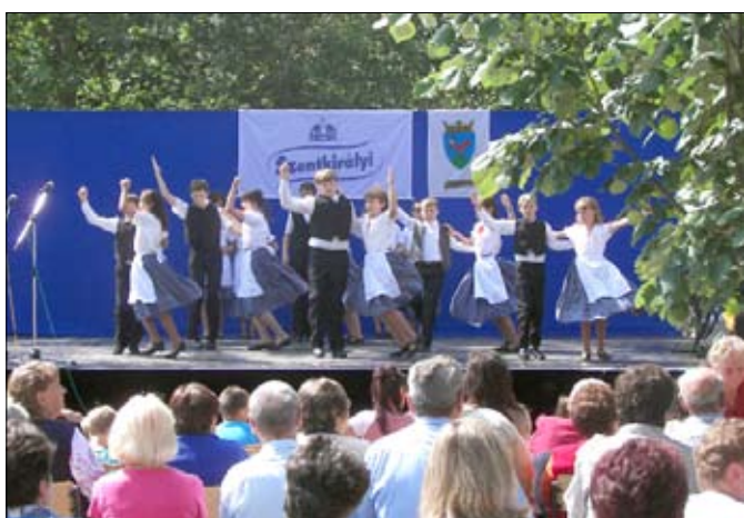
Táncosok a színpadon