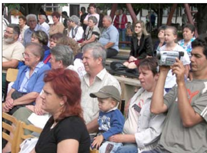
A néző közönség