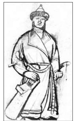
Magyar harcos öltözéke a X. században.

termetű ökröt vették igába. Rendszerint ezekből 6-8-at kellett egy eke elé befogni. A szláv típusú könnyű faeke ele rendszerint csak két ökröt fogtak. Az aratást sarlóval végezték. Csak az újkorban terjedt el a XX. században is használatos kasza, melyet akkoriban a széna levágására használtak.