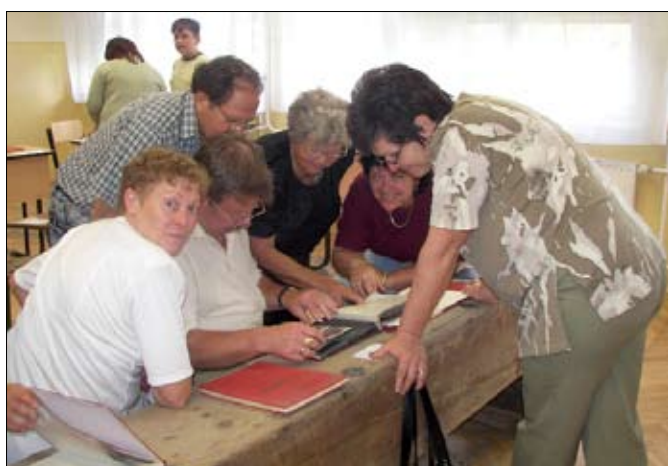
Lapozgatás az emlékek között